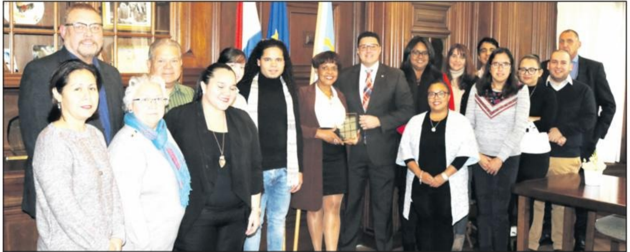
sr. Besaril a bisa.

E mandatario a bisa tambe cu esaki ta parti di su vision na Hulanda. ‘Mi a bin ta eherce e funcion di Minister Plenipotenciario cu un agenda politico. Pero banda di esaki mi a bin pa Arubahuis como organizacion. Pesey diabierna ultimo nos a para keto pa prome biaha na e hecho cu e aña aki ta haci 35 aña cu Aruba tin un representacion na Hulanda. Y tambe mi tey pa e comunidad Arubano na Hulanda pa ilustra e contribucion positivo cu e comunidad ta haci aki na Madre Patria. Y e encuentro awe na Aruba ta muestra di esaki.’